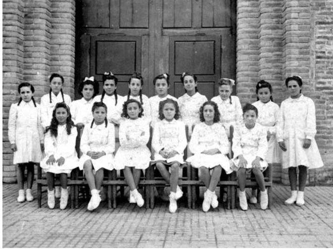
Figura 6. Alumnes de l'Acadèmia Ninou - Col·legi Ibèric del Sagrat Cor, davant de la porta de l'església, dècada de 1940.