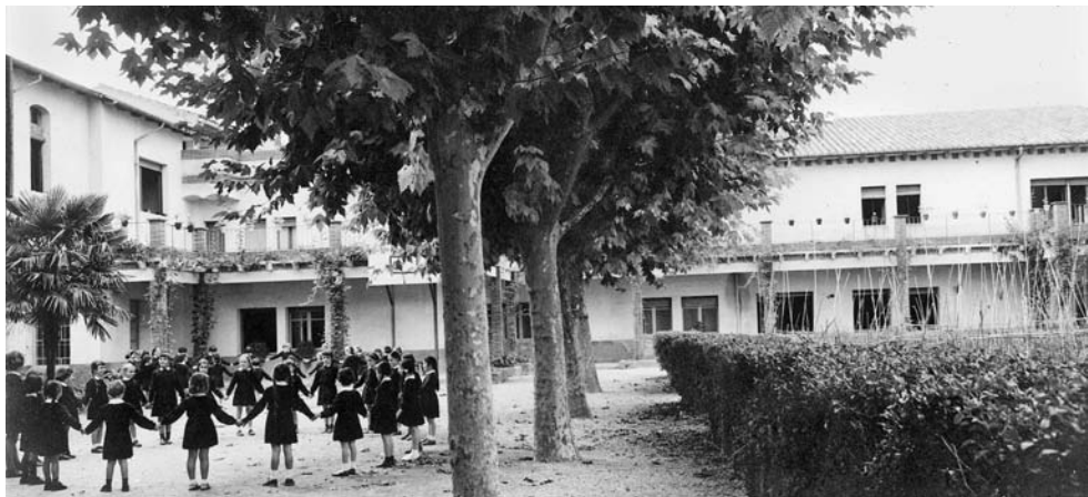
Figura 3. Alumnes al pati de les monges (Lestonnac), dècada de 1960.