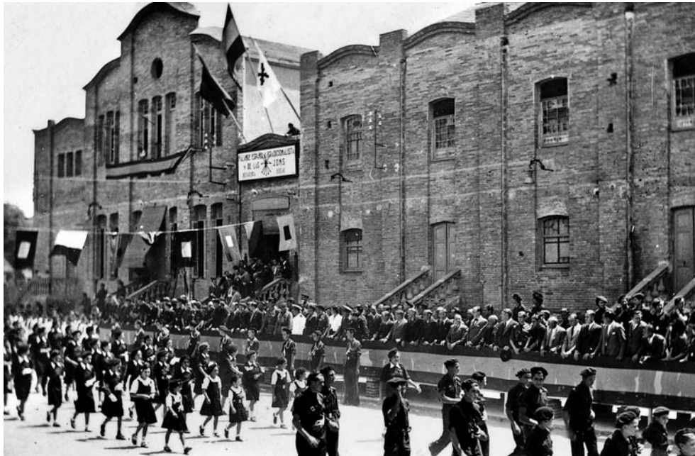
Figura 1. Desfilada de la Falange Española Tradicionalista y de las JONS davant el Tabaran, a la dècada del 1940.