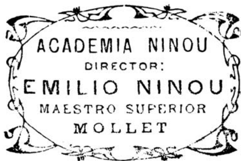
Figura 4. Segell de l'Acadèmia Ninou.

L'acadèmia tingué diferents ubicacions al llarg del temps. Originàriament, se situà a una casa de l'avinguda de Jaume I. A la dècada dels anys trenta, l'escola es traslladà davant de l'església de Sant Vicenç, a la primera planta de can Solà. A partir dels anys cinquanta fins el seu final, l'acadèmia es traslladà al carrer de la Diputació. Les instal·lacions sempre foren petites, hi hagueren poques aules i tampoc gaudí d'un pati propi.