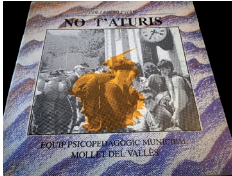
Figura 1. Publicació No t'aturis

famílies; Guia d'activitats educatives , que era el recull de totes les activitats a desenvolupar al llarg del curs escolar i una breu descripció sobre el contingut i a qui anava adreçat. Aquesta publicació era un instrument informatiu per a tota la comunitat educativa.