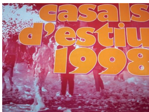
Figura 4. Casals d'estiu 1998

El seguiment i la coordinació del programa