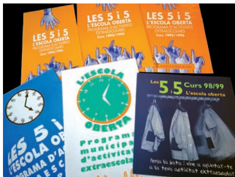
Figura 3. Diferents díptics del programa Les 5 i 5

s'habilitarien les partides necessàries en el pressupost de l'any 1991. El cost total del programa per a aquesta primera edició estava en 6.063.000 pessetes (poc més dels 36.000 euros actuals) en despeses aplicables als capítols II i IV.