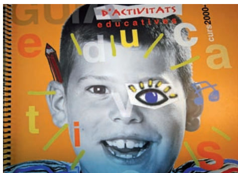
Figura 6. Guia d'activitats educatives curs 2000/2001

El programa va tenir un fort impacte en la comunitat educativa de Mollet. Més enllà que va servir perquè molts nens i nenes tinguessin oportunitat —en plànol d'igualtat— de disposar d'activitats en el seu temps lliure (la mitjana al llarg d'aquests anys va estar per sobre dels sis-cents participants), també va