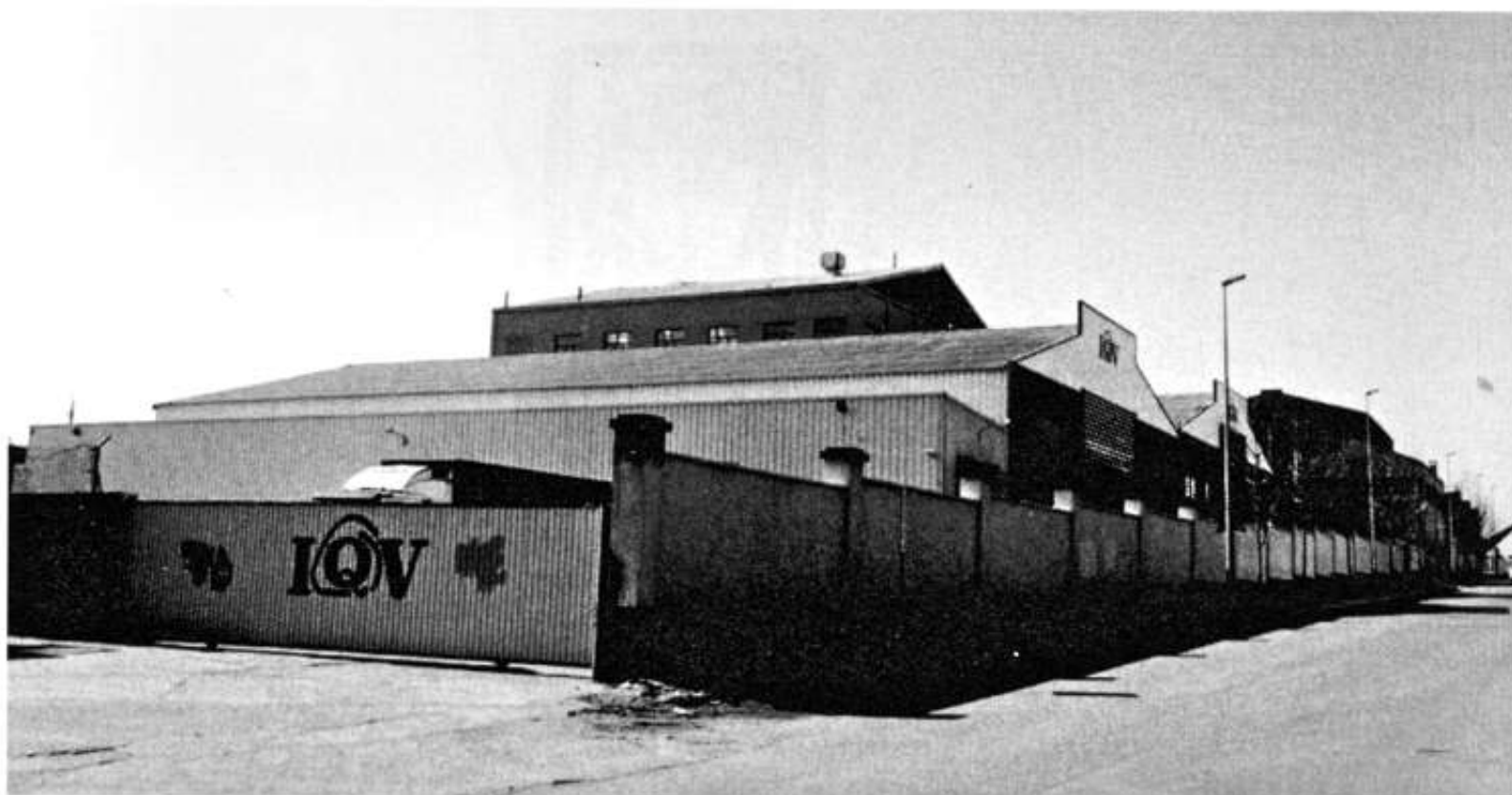
Les Instal·lacions d'IQV a l'avinguda de Rafael Casanova núm. 81.

Aquest creixement en productes va anar acompanyat no només de noves instal·lacions, com els forns de fundició (1960-69), el magatzem (1980), els cristal·litzadors continus (1987), les línies d'envasat i plantes per a noves formulacions (2003), sinó també d'un important i continuat increment dels seus recursos humans.