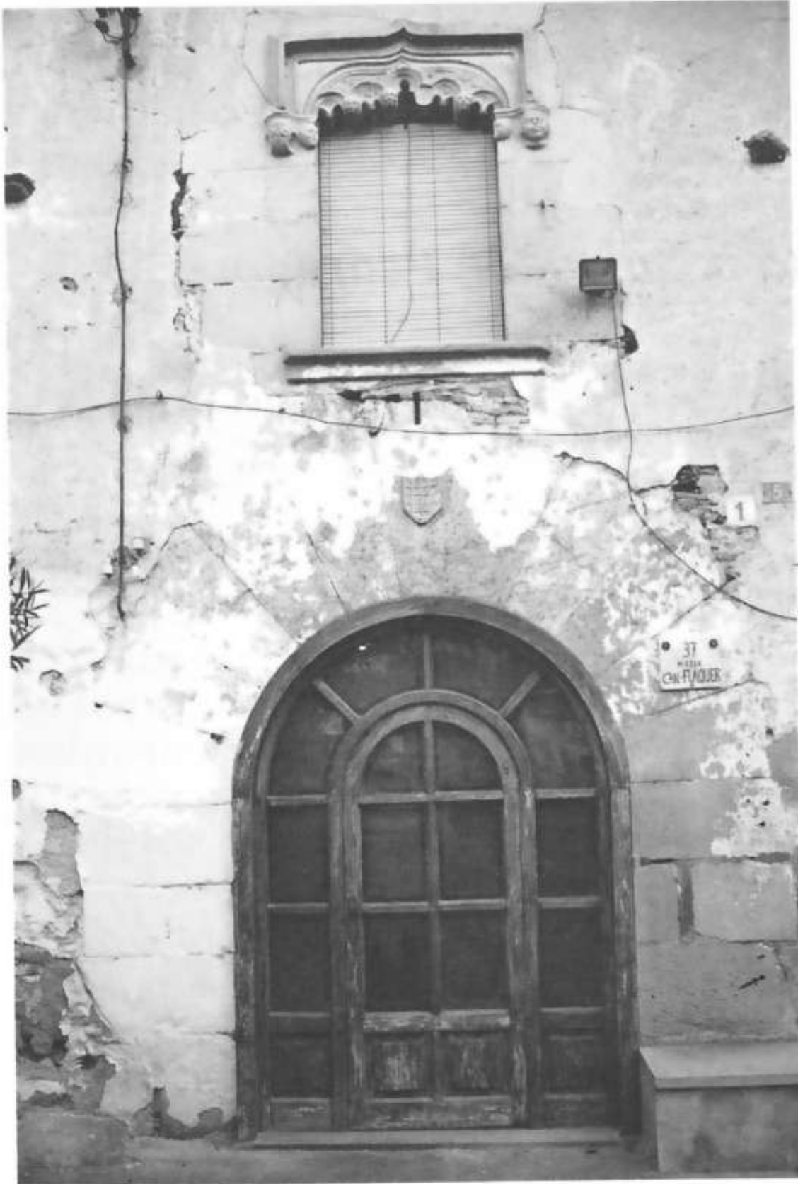
Un aspecte de la façana principal de Can Flaquer

La família de la mare també provenia de fora, concretament de Vilanova i la Geltrú. També van venir al poble a fer de pagesos.