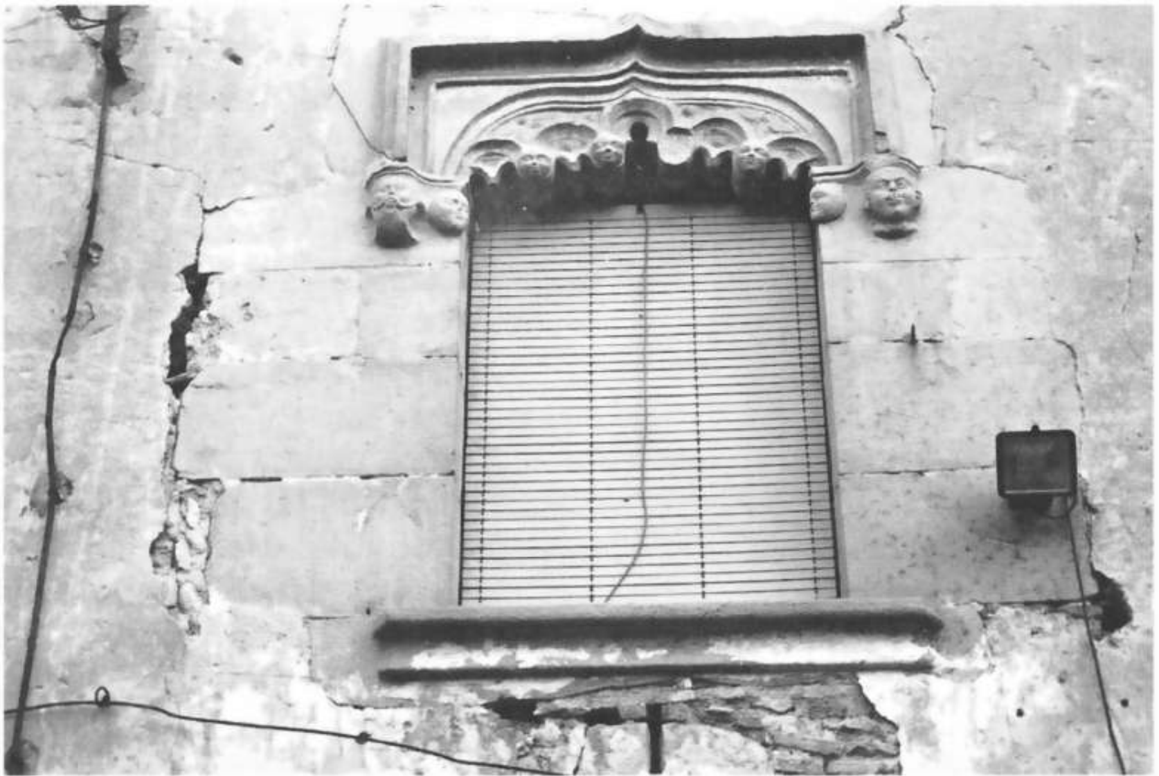
Finestral gòtic de Can Flaquer

Conversar amb els germans Pedragosa ens ha servit per a conèixer el pagès i el seu món de més a prop. Un món que ha afaïçonat, al llarg de molts segles, el paisatge que ens ha arribat fins als nostres dies i que ara, degut al creixement de les nostres ciutats, es veu amenaçat. En aquest sentit l'entrevista vol ser una humil aproximació per a conèixer de més a prop l'activitat de pagès i, en definitiva, un món que a Mollet del Vallès està en vies d'extinció.