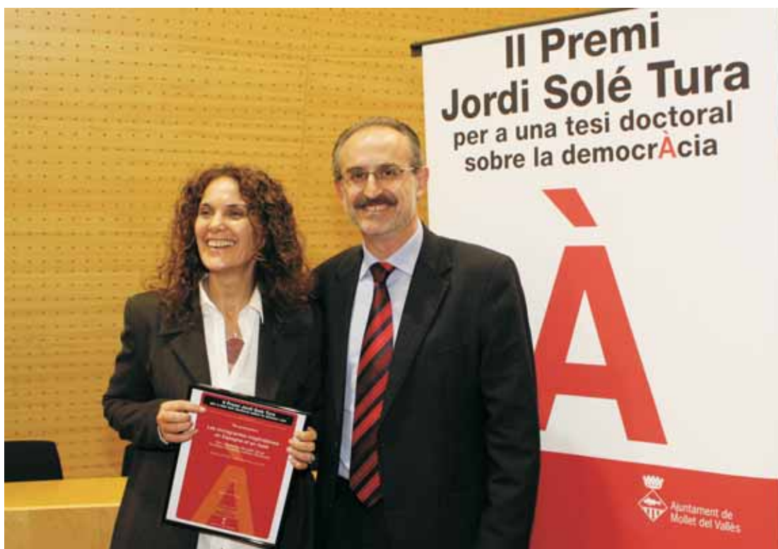
La guanyadora amb l'alcalde de Mollet, moments després de rebre el Premi

descoberta i promoció de joves valors de la investigació acadèmica. Solé Tura va ser diputat pel PSUC en les primeres eleccions legislatives i com a tal va participar en la redacció de la Constitució. Gràcies a les seves conviccions socialistes i a la seva capacitat de convèncer, la Constitució de 1978 ja reconeix un estat de dret, social i democràtic, el dret d'autonomia de les diferents nacionalitats i els drets inviolables de tota persona segons la Declaració Universal dels Drets Humans. Drets, tots ells, molt revolucionaris per l'època, just sortint d'una llarga dictadura. Tot això, és el que va destacar la consellera de Justícia i neboda de Solé Tura, Montserrat Tura, en la conferència que va impartir en l'acte de commemoració del Dia de la Ciutat.