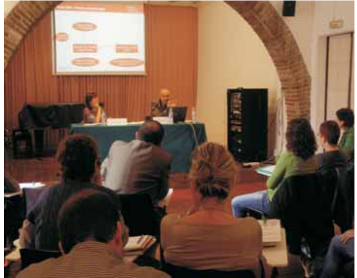
Jornada comarcal sobre planificació estratègica, a La Marineta

En les darreres setmanes, l'agenda d'activitat del II Pla Estratègic de Ciutat ha estat especialment activa. S'han celebrat sessions de treball del Consell plenari i de la Comissió permanent i una jornada comarcal sobre planificació estratègica que ha acollit representants de diversos municipis vallesans i barcelonins per intercanviar experiències a l'hora de pensar en el seu futur. La Comissió permanent, la Comissió tècnica i el Consell plenari han estat treballant per aprovar les línies estratègiques del Pla i els seus objectius, on quedarà establert l'escenari de futur cap a on s'orienta la ciutat. Les diferents línies estratègiques amb els seus corresponents objectius ja sumen 43 projectes observats en el primer esborrany del pla.