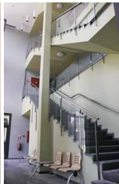
Interior de l'equipament