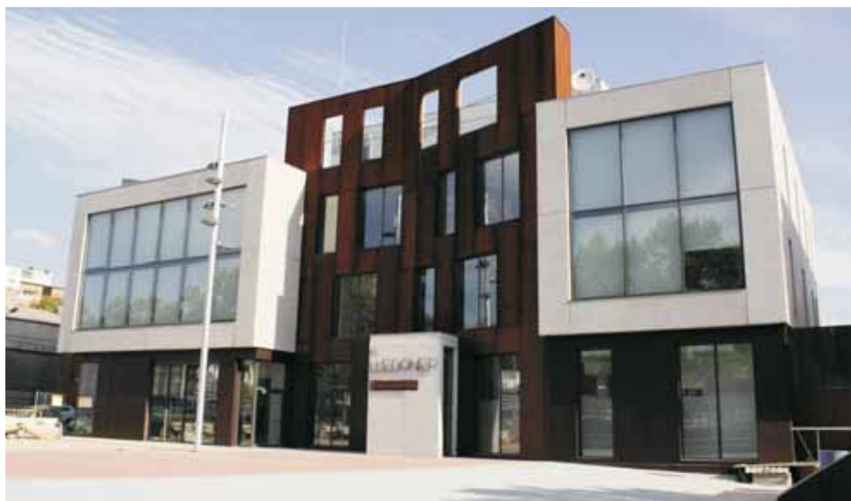
Façana de l'edifici d'El Lledoner

A l'edifici del Lledoner també hi ha els estudis de Ràdio Mollet i els del Consorci Teledigital Mollet. Ràdio Mollet s'ha traslladat a un espai més modern i lluminós que les antigues dependències de Jaume I, amb dos estudis de gravació, espais de treball, reunió, etc. Per la seva banda, el Consorci Teledigital tindrà a El Lledoner els estudis centrals del nou canal de TDT Vallès Visió que començarà a emetre a partir de l'abril de l'any vinent.