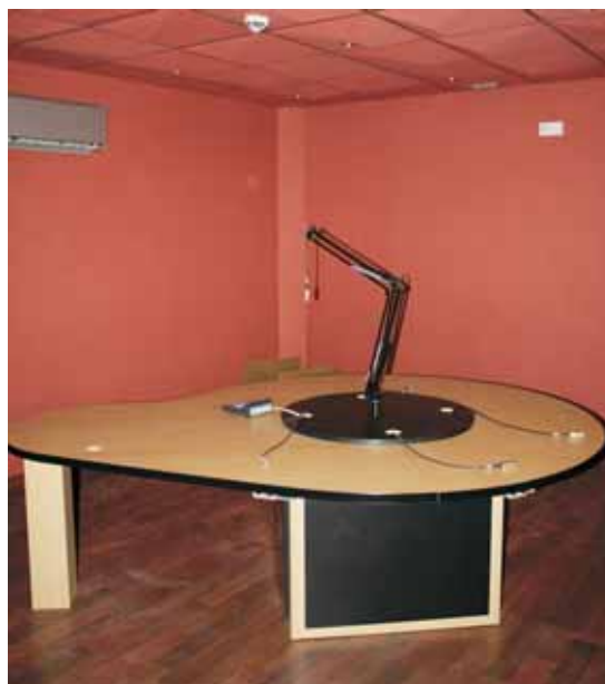
Estudi de gravació de Ràdio Mollet