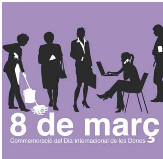
Imatge del programa del dia 8 de març

Bibliografia sobre la dona i la literatura