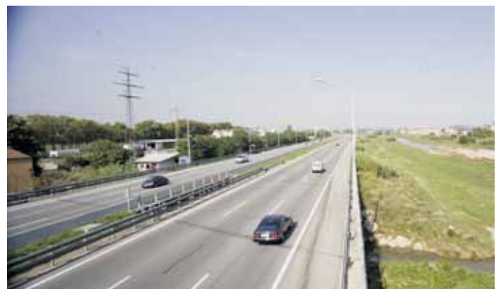
Imatge de la carretera de la C-17 al seu pas per la ciutat