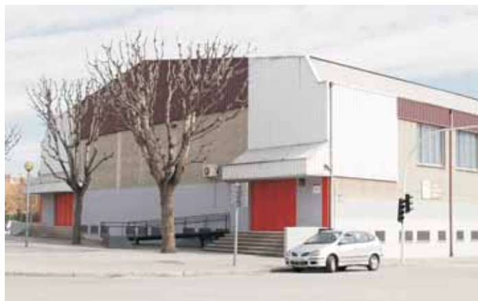
Pavelló Municipal d'Esports de Riera Seca

Aquestes obres, que costaran 16.000 euros, començaran a principis del mes de juny i tenen una durada prevista d'un mes.