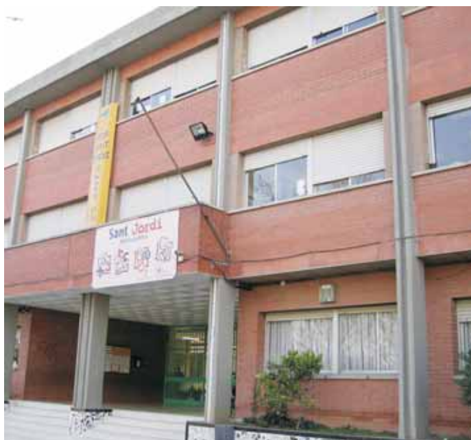
Façana del CEIP Sant Jordi

Aquests treballs es faran durant els mesos de juliol i agost. El pressupost és de 49.000 euros.