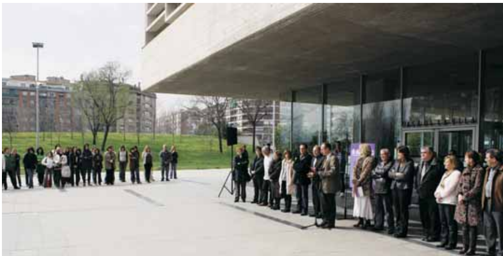
Lectura del manifest del 8 de març davant de la Casa de la Vila

Durant l'any 2007 es va fer un procés d'elaboració del pla anomenat Diagnosi de gènere i igualtat d'oportunitats, on van participar unes 30 dones. També se'n van entrevistar 33 més, així com responsables de les entitats de dones.