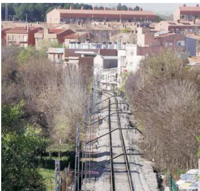
La línia del Nord al seu pas pel barri de Santa Rosa